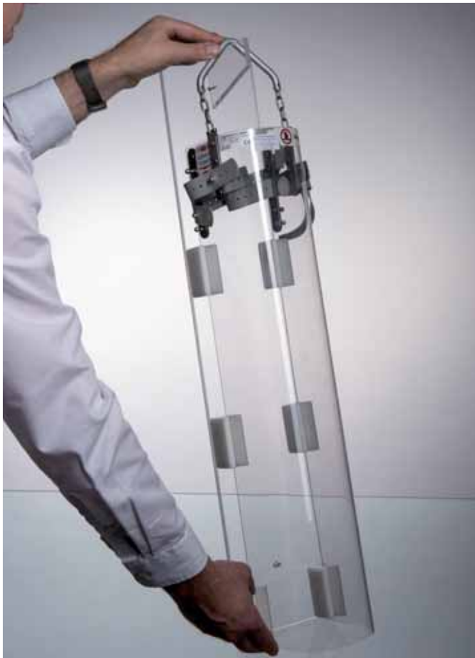
BABIX ® -Hülle auf BABIX ® -Spanner

Die BABIX ® -Hüllen sind Hilfseinrichtungen für die Röntgenuntersuchungen an Säuglingen und Kleinstkindern. In den BABIX ® -Hüllen können Säuglinge und Kleinstkinder für die Röntgenuntersuchung vorbereitet werden. Während der Untersuchung sind die Patienten in den Hüllen gut fixiert, ohne dass sich eine oder mehrere Personen zum Festhalten im unmittelbaren Strahlungsbereich aufhalten müssen. Die BABIX ® -Hüllen können wahlweise hängend an einem Untersuchungsgerät, z. B. für Thorax- oder Abdomenaufnahmen oder liegend auf einem Bucky-Tisch, z. B. für Aufnahmen der Wirbelsäule in jede gewünschte Aufnahmeposition gebracht werden.