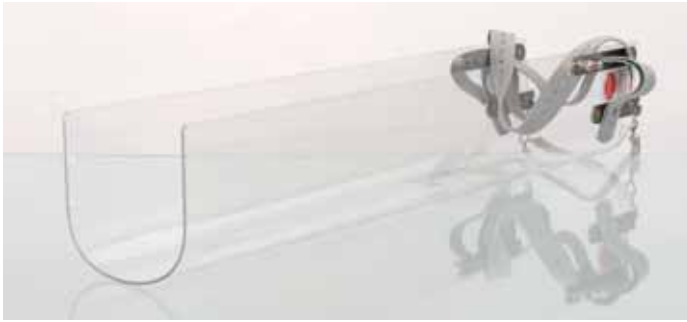
U-förmige BABIX ® -Hülle

Die BABIX ® -Hüllen sind Hilfseinrichtungen für die Röntgenuntersuchungen an Säuglingen und Kleinstkindern. In den BABIX ® -Hüllen können Säuglinge und Kleinstkinder für die Röntgenuntersuchung vorbereitet werden. Während der Untersuchung sind die Patienten in den Hüllen gut fixiert, ohne dass sich eine oder mehrere Personen zum Festhalten im unmittelbaren Strahlungsbereich aufhalten müssen. Die BABIX ® -Hüllen können wahlweise hängend an einem Untersuchungsgerät, z. B. für Thorax- oder Abdomenaufnahmen oder liegend auf einem Bucky-Tisch, z. B. für Aufnahmen der Wirbelsäule in jede gewünschte Aufnahmeposition gebracht werden.