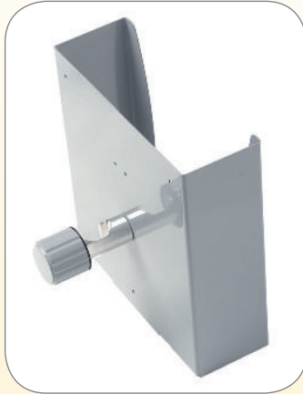
△ Abb. oben

Für Stative, Infusionsständer und Rohre von 20 bis 30 mm Durchmesser