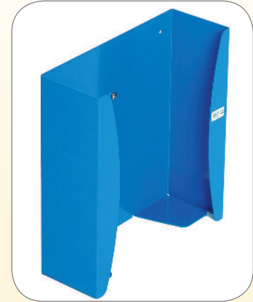
△ Abb. oben

HANDSCHUHSPENDER für Wandmontage. Ausführung in Aluminium. Empfohlene Ausführung für OP-Bereiche in Edelstahl gebürstet.