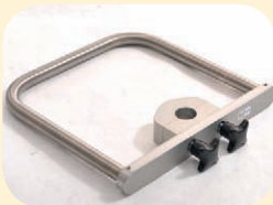
Varitroll Griffbügel für Infusionsständer und Stative, superstabil, Befestigung mit Sterngriff oder Inbusschrauben, B/T 30 x 30 cm Best. Nr. 60020