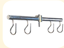
Hakenleiste 4-strahlig, 39 cm lang Best. Nr. 51561 Dto. 6-strahlig, 46 cm lang Best. Nr. 51563