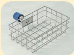
Sterilgutkorb B/T/H 30 x 20 x 10 cm, aus Edelstahl Best. Nr. 51463 Einlegeboden Best. Nr. 51466