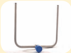
Infusiomat Gabelhalterung mit Befestigung aus V2A, B/H 40 x 40 cm Best. Nr. 51010