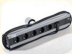
Steckdosenleiste SECURPOT mit Potentialabgang, 6-fach mit Befestigung, Länge 46 cm Best. Nr. 51538

KONFIGURIEREN SIE NACH IHREM ANFORDERUNGSPROFIL ULF SYSTEMS Anbauteile sind binnen Sekunden befestigt. Ohne Werkzeug. Sicher.