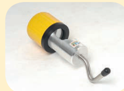
Universalhaken belastbar bis 10 kg, für Spülbeutel mit Kloben Maxi Best. Nr. 51422

Einige von Hunderten von Möglichkeiten. Für alle Disziplinen. Fragen Sie nach dem ULF SYSTEMS-Katalog oder fragen Sie Ihren Fachhändler. Rufen Sie uns an oder besuchen Sie uns auf www.ulf-systems.de .