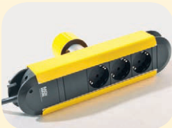
Steckdosenleiste ION 1 3-fach mit Befestigung Best. Nr. 51536 Dto. 6-fach mit Befestigung Best. Nr. 51537