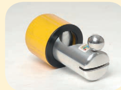
Hahnbankhalter für diverse Hahnbänke mit Klemmvorrichtung Best. Nr. 51106