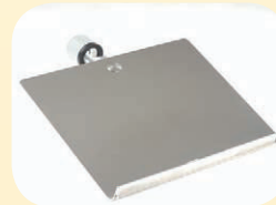
Pultplatte für Laptop, Kurvenblätter, 40 x 32 cm, belastbar bis ca. 6 kg, gerade oder 30 Grad Neigung. Best. Nr. 54552